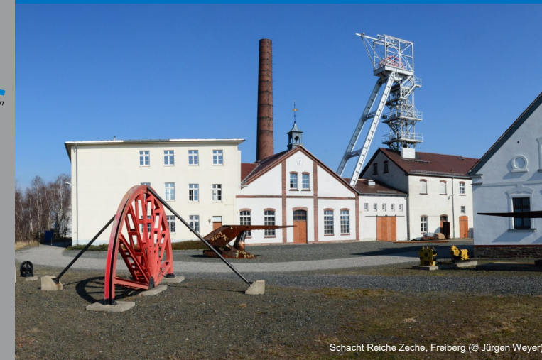
Schacht Reiche Zeche, Freiberg