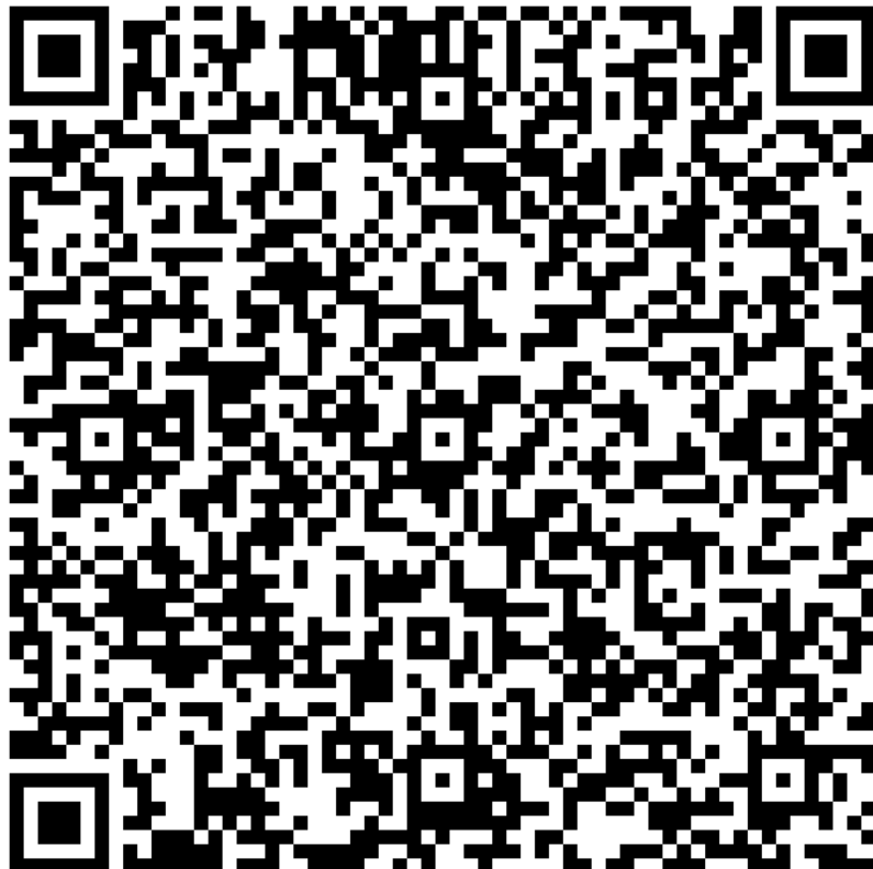
Рисунок 2. QR-код с ссылкой на карту