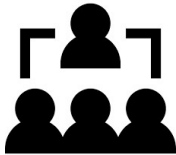
Juristische Mitarbeiter (Kanzlei, Verwaltung, Verbände)