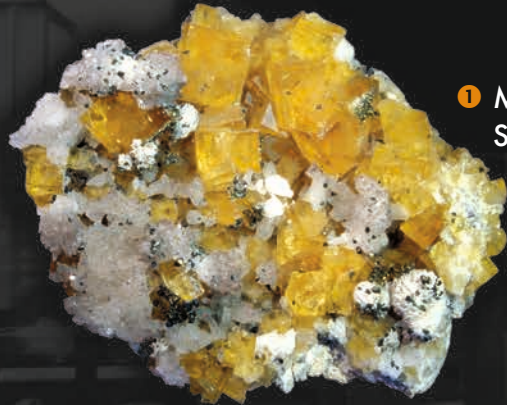
1 Mineralogische Sammlung